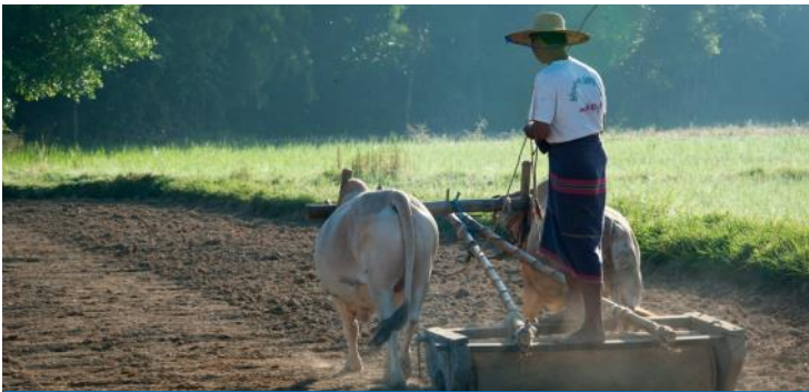
ရခိုင်ပြည်နယ်ရှိ WFP ၏ စီမံကိန်းမှ လယ်မြေညှိခြင်းလုပ်ငန်း

အရင်းအနှီးရင်းမြစ်များကို လူထုပါဝင်မှုဖြင့် ထူထောင်ပေးခြင်းဖြစ်ကာ၊ လိုအပ်ချက်ဆန်းစစ်မှု၊ ဦးစားပေးအဆင့်သတ်မှတ်ခြင်း၊ စီမံကိန်းပုံစံ ရေးဆွဲခြင်းနှင့် ဖော်ဆောင်ခြင်း လုပ်ငန်းအဆင့်များတွင် လူထုမှ ၎င်းတို့၏ကိုယ်ပိုင်ကဲ့သို့သဘောထားရှိမှုကို ဖော်ပြခဲ့ကြသည်။